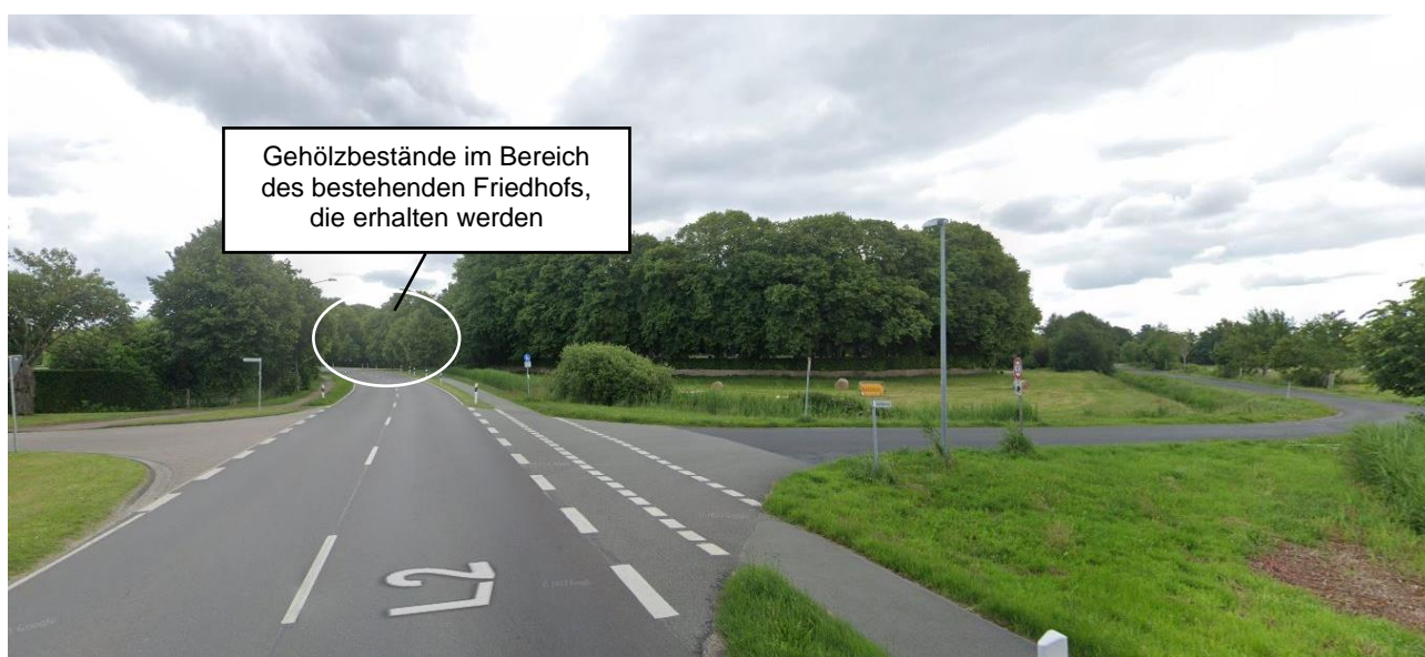
Abb. 1 Blick Richtung Osten

Gemäß § 8 NDSchG dürfen in der Umgebung eines Baudenkmals Anlagen nicht errichtet, geändert oder beseitigt werden, wenn dadurch das Erscheinungsbild des Baudenkmals beeinträchtigt wird. Bauliche Anlagen in der Umgebung eines Baudenkmals sind auch so zu gestalten und instand zu halten, dass eine solche Beeinträchtigung nicht eintritt. Nach § 10 Abs. 1 Nr. 4 bedürfen die Errichtung, Veränderung oder Beseitigung von Anlagen, die das Erscheinungsbild des Denkmals in seiner Umgebung beeinflussen, einer denkmalrechtlichen Genehmigung. Von einer Beeinträchtigung des Baudenkmals durch die geplante Friedhofserweiterung ist aufgrund der Entfernung und der Ausrichtung nicht auszugehen. Die Friedhofswurt ist aufgrund der vorhandenen Gehölzstrukturen (Hecken, Sträucher und Bäume) nur aus westlicher Richtung in einem Umkreis von maximal 200 m deutlich wahrnehmbar. Die Friedhofserweiterungsfläche ist aus dieser Perspektive durch die genannten Grünstrukturen und die Entfernung nicht sichtbar (siehe Abbildung 1).