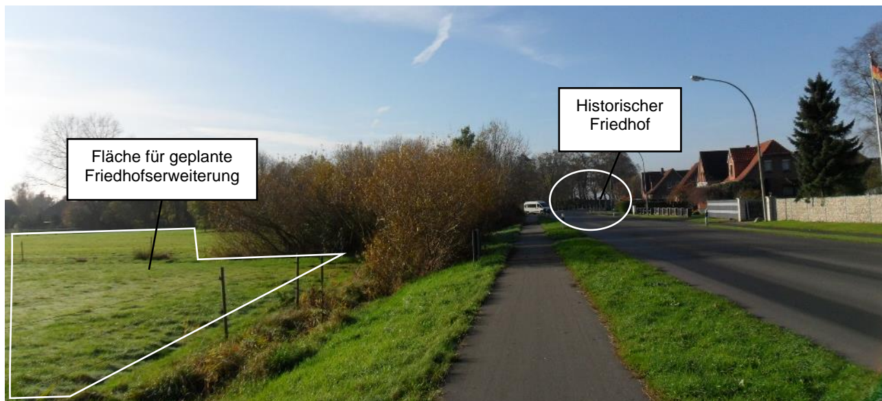
Abb. 2 Blick Richtung Westen Winter

Aus Richtung Osten kommend ist die Friedhofswurt lediglich in den Wintermonaten im unbelaubten Zustand wahrnehmbar. Da der Blick aufgrund des Straßenverlaufs allerdings nicht versperrt wird, kann auch hier eine Beeinträchtigung des Denkmals ausgeschlossen werden (siehe Abbildung 2 & 3).